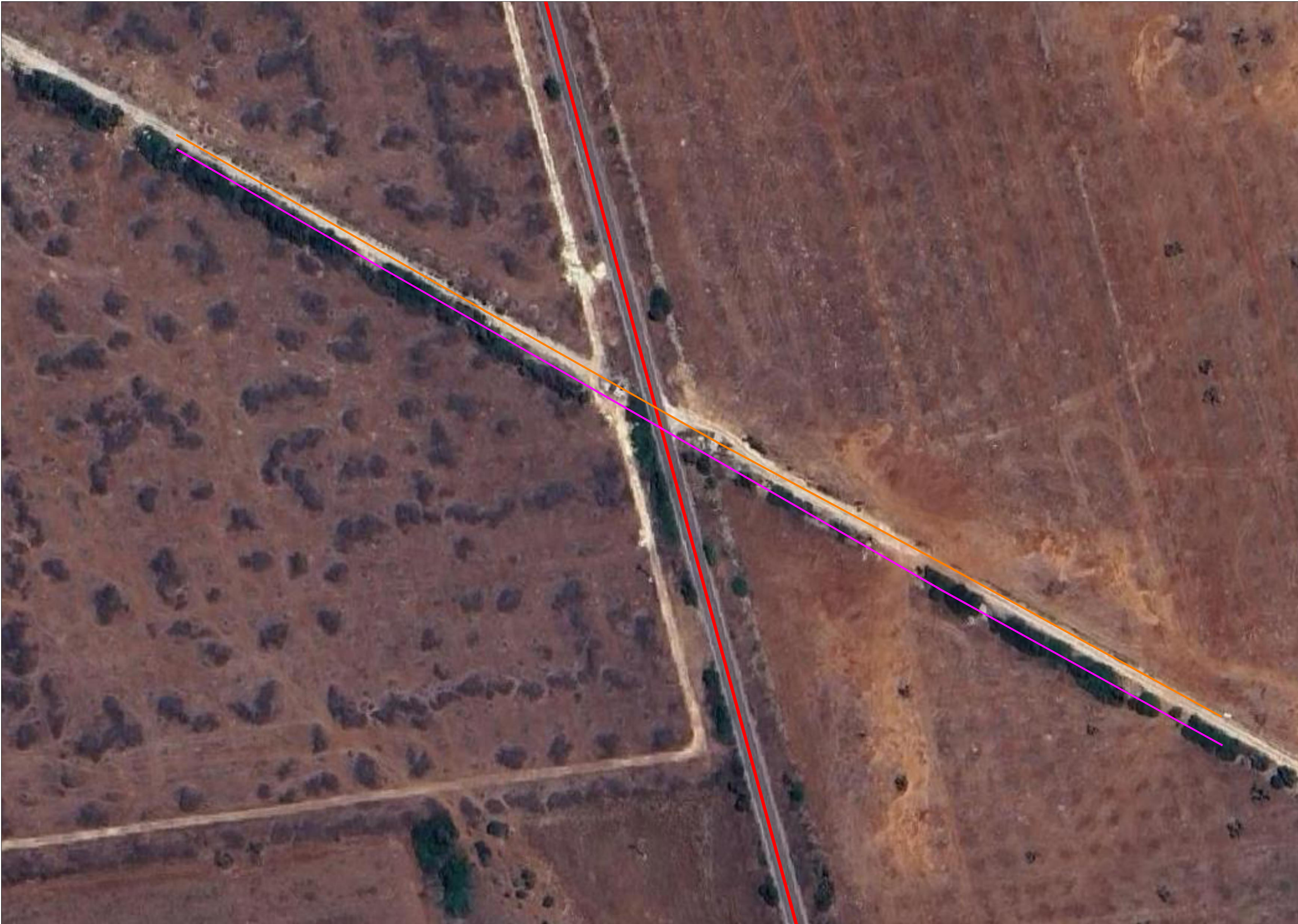
Inquadramento di dettaglio della possibile nterferenza 2 tra i sostegni del nuovo raccordo aereo e le condotte idriche in acciaio DN 1400 e cemento armato DN700 - Scala 1:1.000